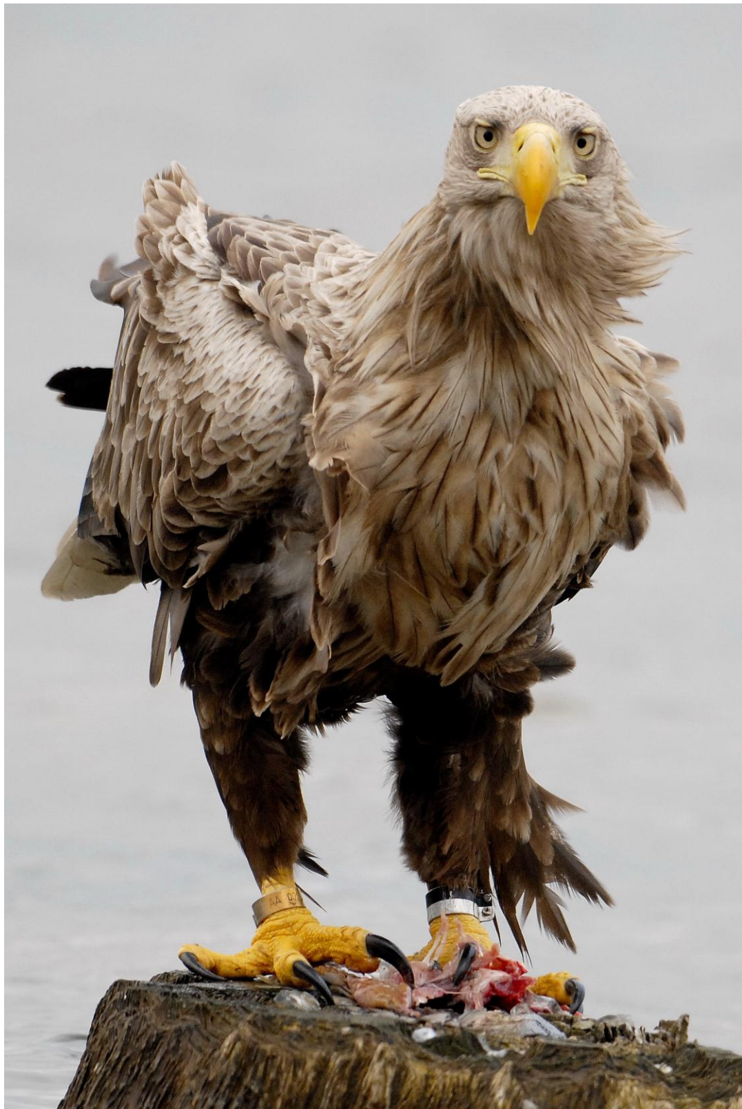
Adulter Seeadler an den Angermünder Fischteichen