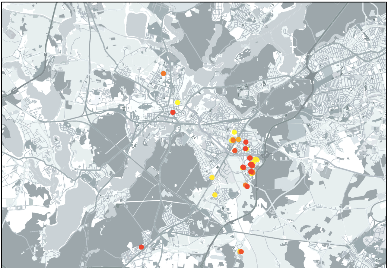
Abb. 3: Beobachtungen der Haubenlerche im Berichtsgebiet: Im Farbverlauf von gelb (2004) bis rot (2010) nach Daten aus den Jahresberichten für Potsdam. (Karte: © OpenStreetMap-Mitwirkende)

7.4. 1 ♂ Bhf. Golm (W. Mädlow); 24.6. 3 Parforceheide Große Wendemark (K. Steiof)