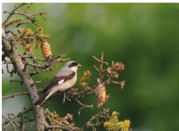
Abb. 2: Schwarzstirnwürger, Alter Friedhof (W. Püschel)

20.5. 1 jagendes Ind. Alter Friedhof (W. Püschel) hielt sich abends für \geq 1\frac{1}{2} Std. auf und jagte von einer Konifere aus Insekten