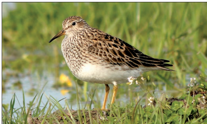
Abb. 3: Graubruststrandläufer 27.4.08 Lenzener Elbtalaue/PR.