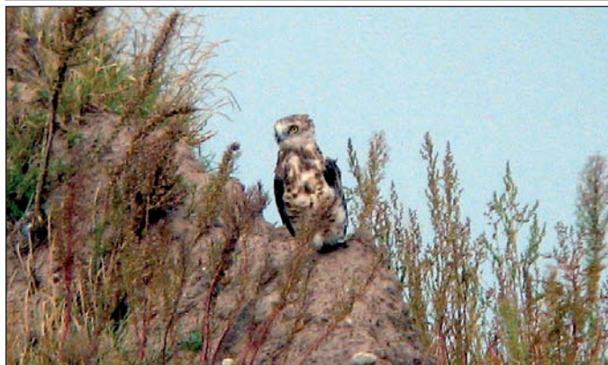
Abb. 4: Schlangenadler 10.9.08 Tagbau Jänschwalde/SPN.

Mittelmeermöwe, Larus michahellis : * 2 ad. ab 31.03.2005, Brutpaar, drei juv., Stoßdorfer See/LDS (DONATH 2005); AKBB 1375: Bestimmung nur anhand der Flügelzeichnung nicht ausreichend, keine Beschreibung von weiteren, sicheren Artkennzeichen, kein Ausschluss von Hybridvögeln.