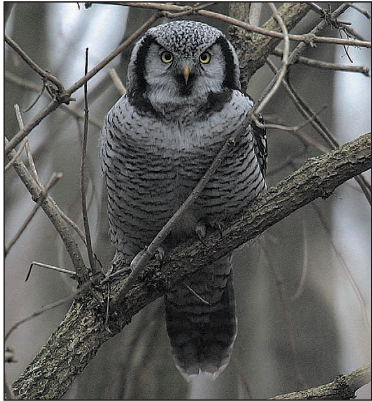
Abb. 3: Spereule, Februar 2006 bei Dubrau, Niederlausitz.

gewöhnliche Beobachtungen zur Phänologie gemeldet. Oft existieren keinerlei zusätzliche Informationen zu diesen Beobachtungen. Dieser Umstand macht eine Bewertung schwierig. Noch hat die AKBB keine Festlegungen zum Umgang mit Extremdaten getroffen. In konkreten Einzelfällen wird derzeit noch hinterfragt. Die AKBB bittet daher, Extremdaten durch zusätzliche Informationen und Erläuterungen zu untersetzen und somit nachvollziehbar zu machen (z.B. Auftreten von Wintergästen im Sommer, Spät- und Winterbeobachtungen eigentlicher Zugvögel usw.). Als Orientierung für bemerkenswerte Beobachtungen gelten die Avifauna von Brandenburg und Berlin (ABBO 2001) und die aktuellen avifaunistischen Jahresberichte.