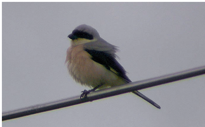
Abb. 3: Schwarzstirnwürgermännchen Juni 2005 bei Brück/PM.