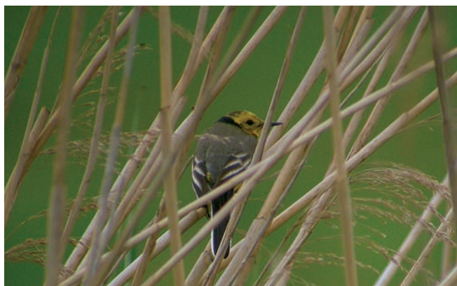
Abb. 4: Zitronstelzenmännchen Mai 2005 Belziger Landschaftswiesen.